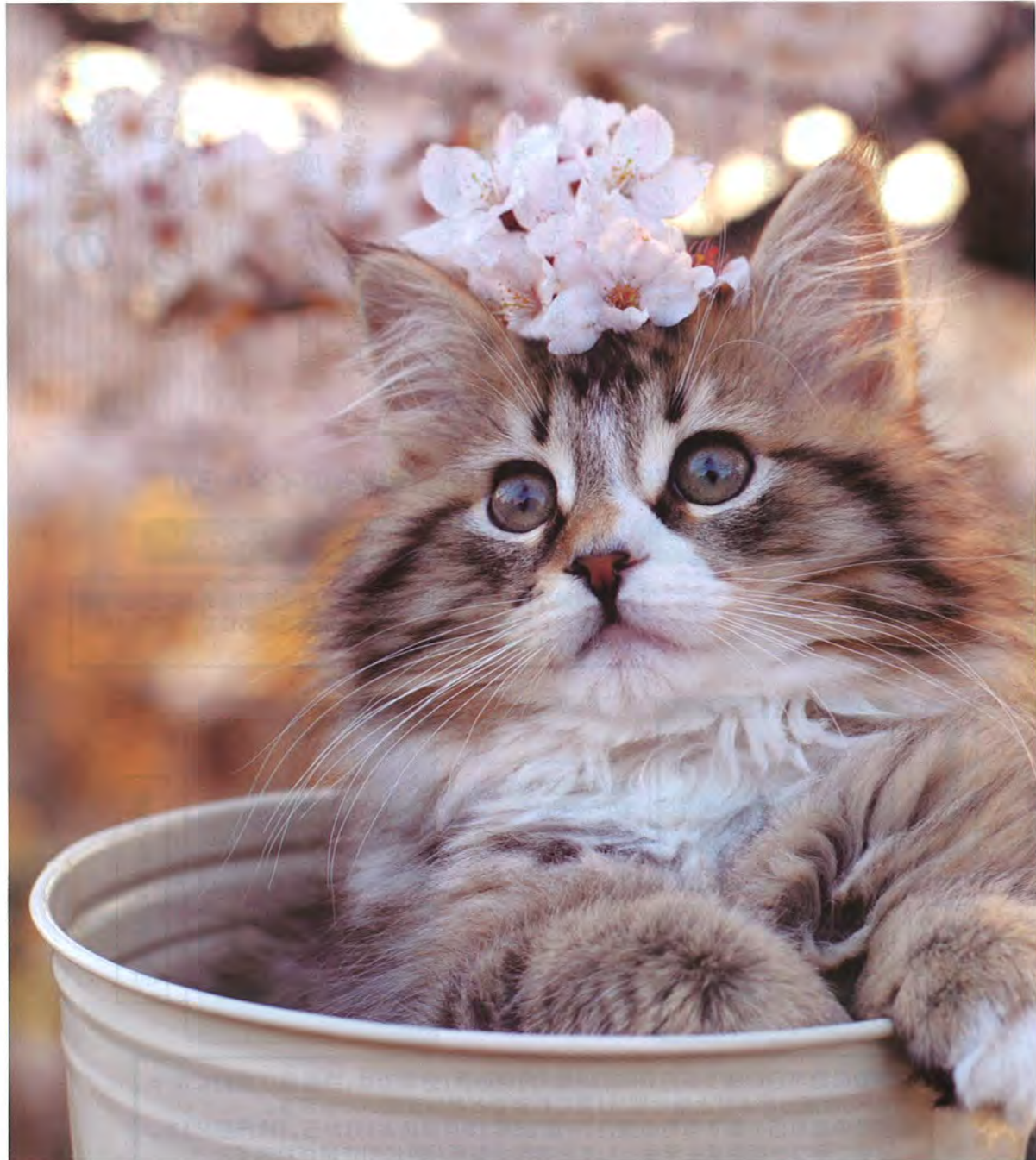
ノルウェージャンフォレストキャット